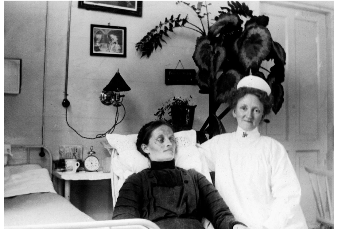
Epidemiologi og sykehushistorie